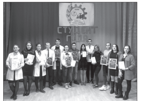
Редакция приносит свои извинения.

В материале «По-студенчески весело и задорно», опубликованном в газете «Родники ирбитские» № 6 от 31 января 2019 года была использована чужая фотография. Иллюстрировать новость нужно было так: